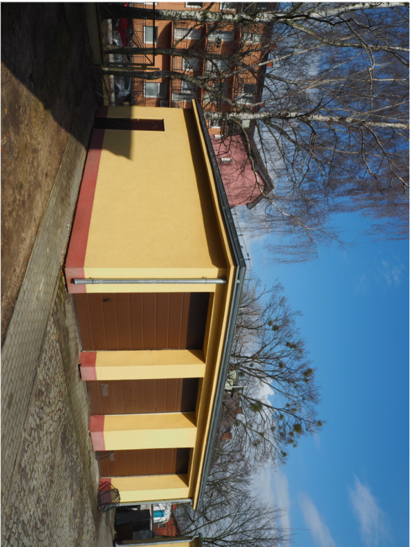
ELEWACJA POŁUDNIOWA I ELEWACJA WSCHODNIA